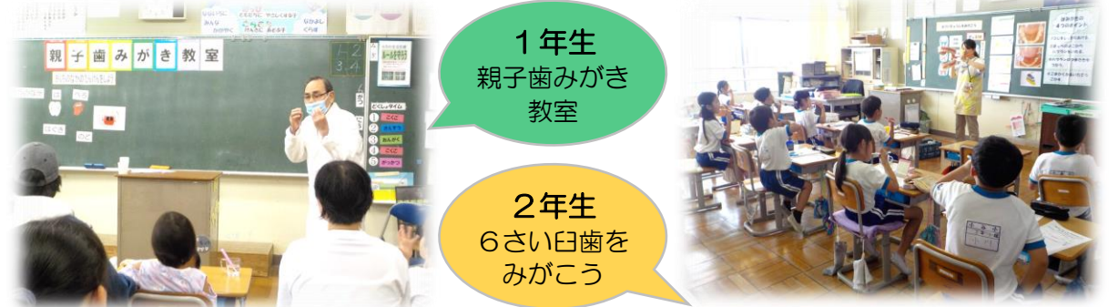
1年生 親子歯みがき教室

むし歯予防や歯周病予防等、各学年に合わせた内容を学習するとともに、歯の染め出しを行ってみがき残しの確認をしました。歯ブラシをこきざみに動かしながら歯を1本1本みがいて、むし歯ゼロの小谷っ子が増えるといいですね！