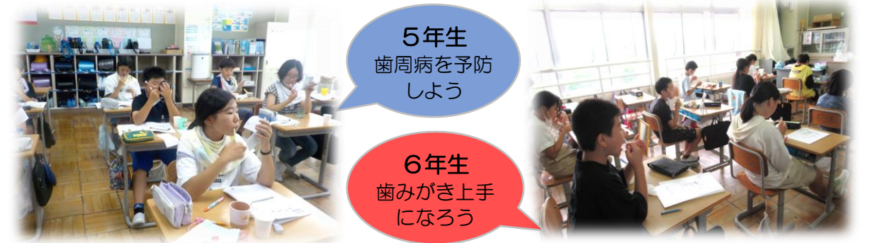
5年生 歯周病を予防しよう