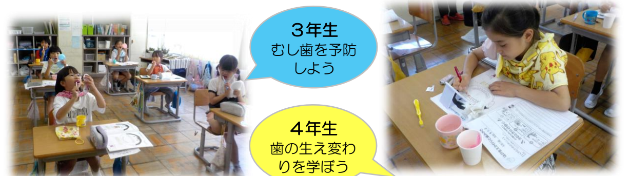
3年生 むし歯を予防しよう